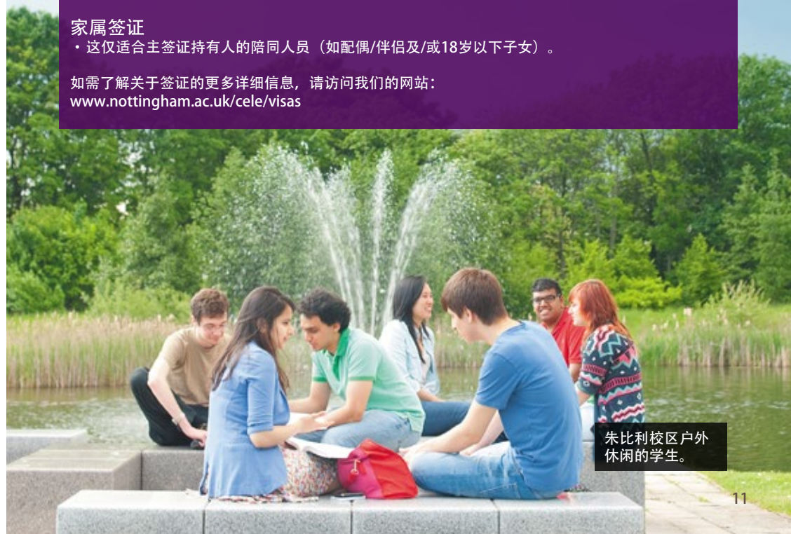
朱比利校区户外休闲的学生。

如需了解关于签证的更多详细信息，请访问我们的网站： www.nottingham.ac.uk/cele/visas