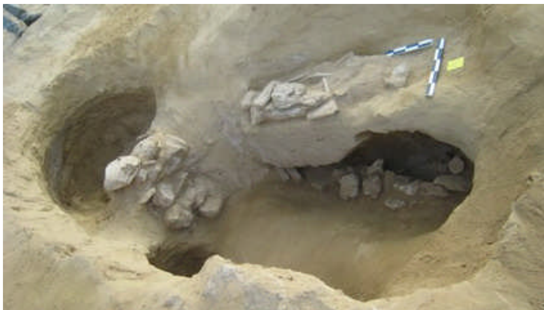
FIG. 3. Strephi. Hybrid or unfinished chamber tomb VI