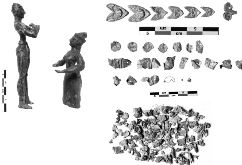
FIG. 8. Messenia, Kambos. Selected finds from the tomb; two lead figurines on the left; gold ornaments (relief beads and cut-outs of foil) on the right.

Even though no pottery is mentioned in the official protocol and receipt of delivery, Tsountas, in his definitive report published in Archaeologiki Ephemeris 1891, made mention of plain sherds and some with banded decoration.