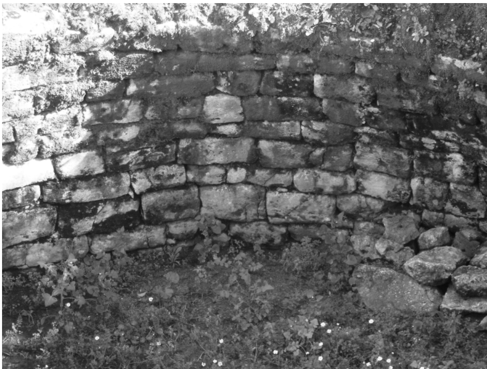
FIG. 6. Messenia, Kambos. View of the masonry of the burial chamber (2009).