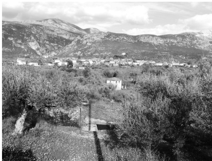
FIG. 3. Messenia, Kambos. View of the tholos tomb and the surrounding area; in the distance, the modern village (2009).