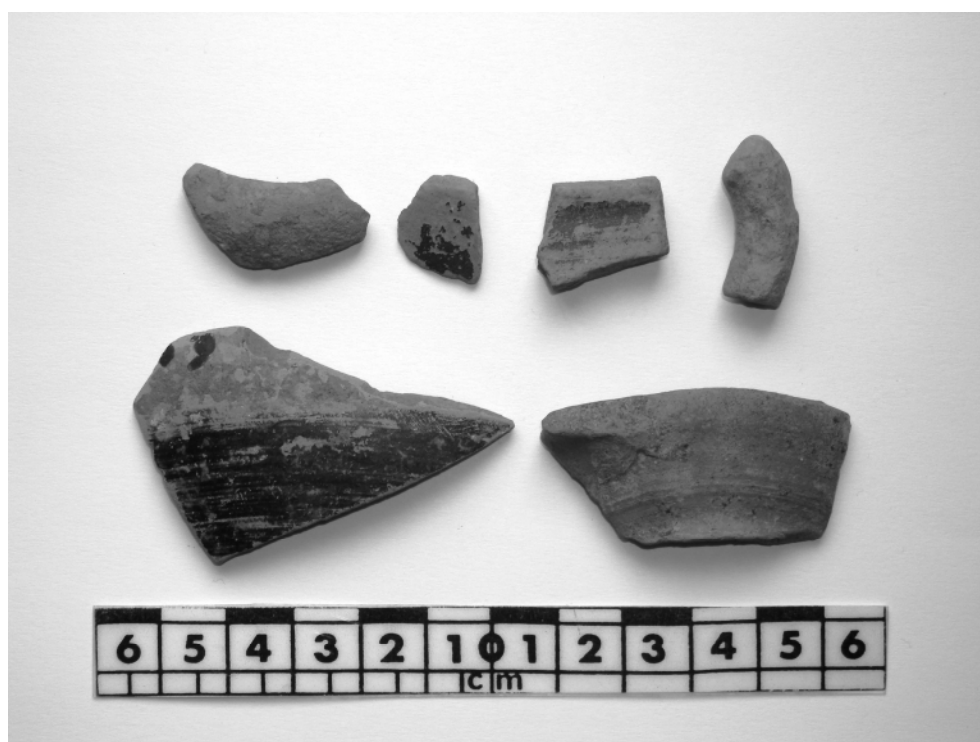
FIG. 9. Messenia, Kambos. Sherds of late Classical–Hellenistic pots that were observed in the vicinity of the tomb (2009).

Furthermore, during later collections in the area of Tsountas's excavation debris, sherds of Late Helladic III have been reported (see below). Sporadic sherds of small black-glazed and other pots occurring in the surrounding area of the monument may be evidence for (cult?) visits at the site during Late Classical–Hellenistic times (FIG. 9). In the report by Chr. Tsountas, mentioned above, small fragments of bone were briefly noted, which, however, could not at the time be attributed with certainty to the contents of the tomb.