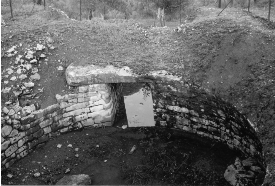
FIG. 5. Messenia, Kambos. View of the interior of the tholos tomb (1999).

reports, highlight the events before and just after the completion of the excavation. From the brief excavation it became apparent that the tholos tomb at Kambos had been looted, despite Tsountas's initial appraisal. Apart from the tholoi at Mycenae, it was the second tholos tomb, after that at Vapheio, to be excavated in the Peloponnese.