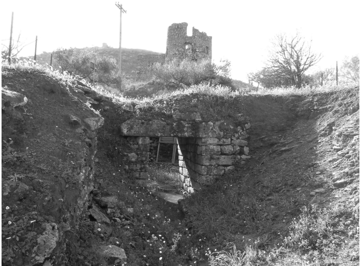
FIG. 4. Messenia, Kambos. View of the dromos and stomion of the tholos tomb. On a higher level, the tower house of Prime Minister Alexandros Koumoundouros (1815–1883) and in the distance, the medieval castle of Zarnata, on the top of a hill (2009).

The tholos tomb is located on the N–NE slope of a low hill with the toponym of Garbelia, on the SW edge of a small fertile plateau (Kambos) ( FIG. 3 ). On the top of the hill are the remains of the tower house of Alexandros Koumoundouros (1815–1883), one of the prime ministers of the (then) newly-founded modern Greek state. On a contiguous higher conical hill to the south lies the medieval tower of Zarnata, constructed on an ancient (Classical/Hellenistic?) foundation ( FIG. 4 ).