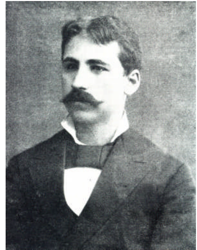
FIG. 2. Chr. Tsountas (1857–1934) (from Gods and Heroes of the Bronze Age Europe, The roots of Odysseus , Greek exhibition catalogue 2000, p. 9).