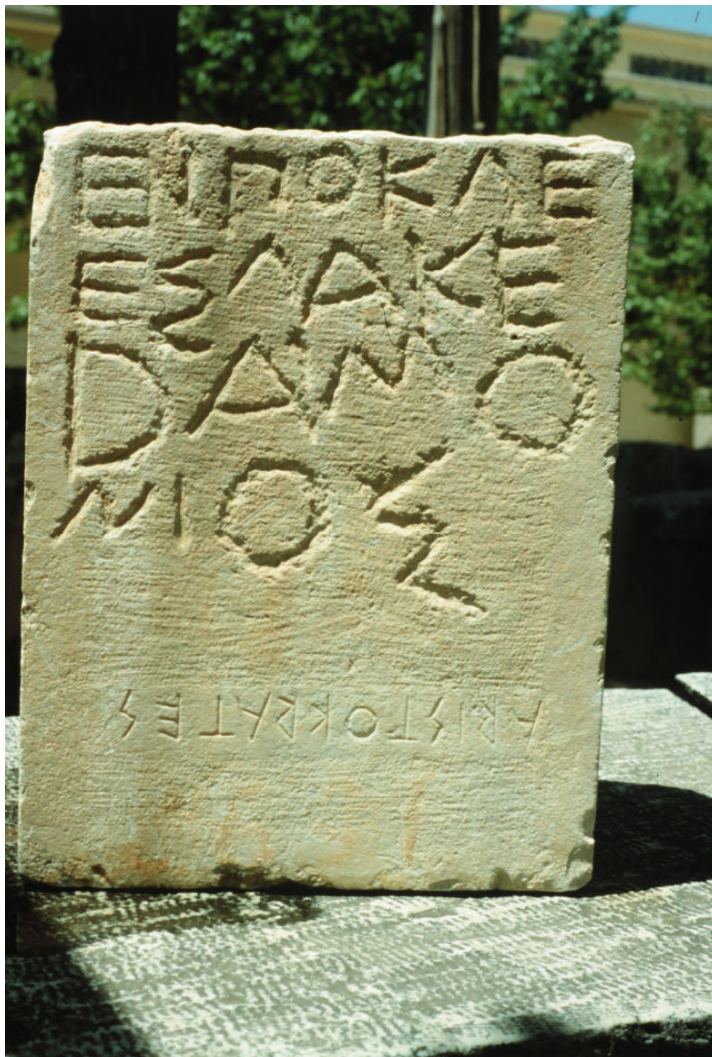
FIG. 2. The limestone stele from Thespiiai.