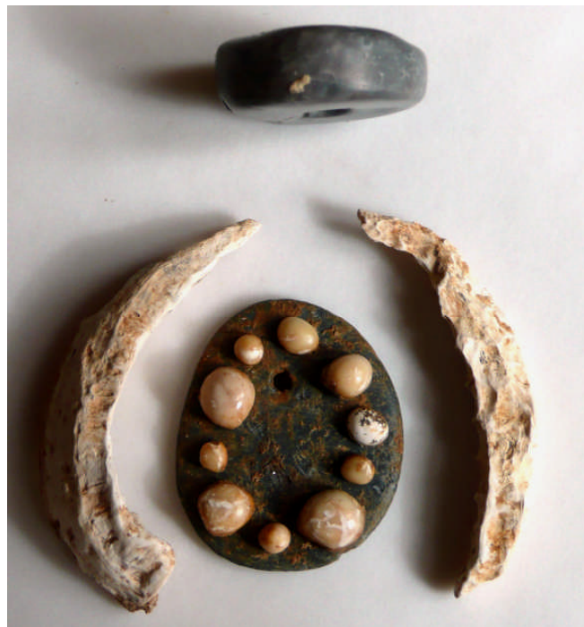
FIG.4. Photograph of the components of the pendant.