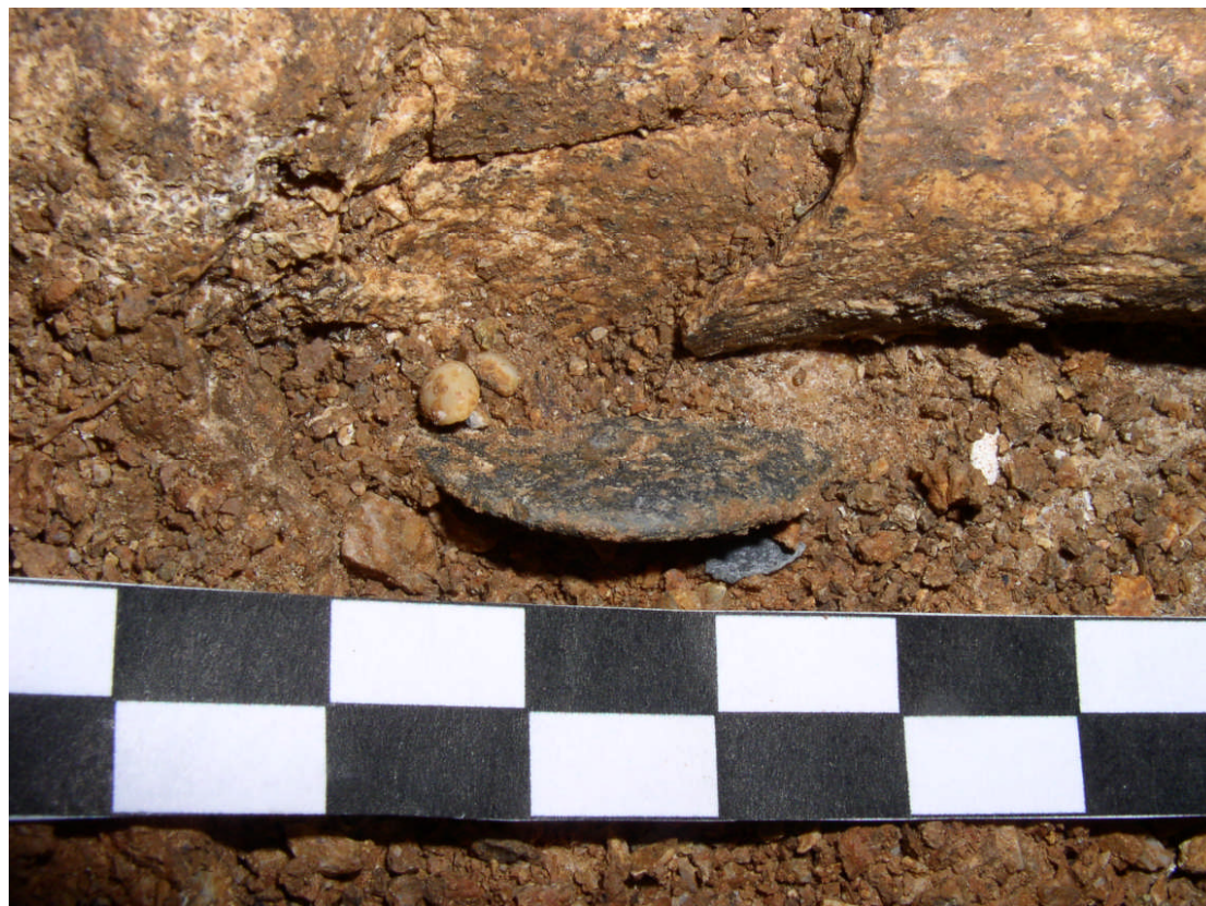
FIG.2. The pendant in situ.

bones. 8 The copper pin was found during the excavation, but the pendant was found later, in 2004, during the conservation of the skeleton, when the rest of the soil was removed. The various parts of the pendant were found near the clavicle and the left humerus of the skeleton (FIG.2). The reconstruction of the pendant motif was made possible through the removal, step by step, of each part and photography of the process.