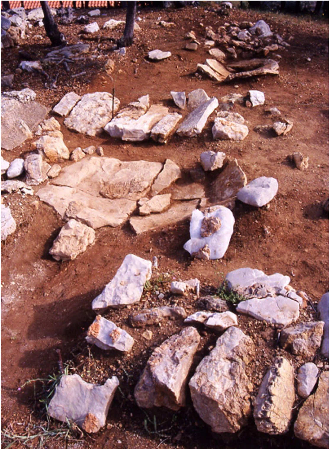
FIG. 1. The three burials and small tumulus at the site of Apollo Maleatas