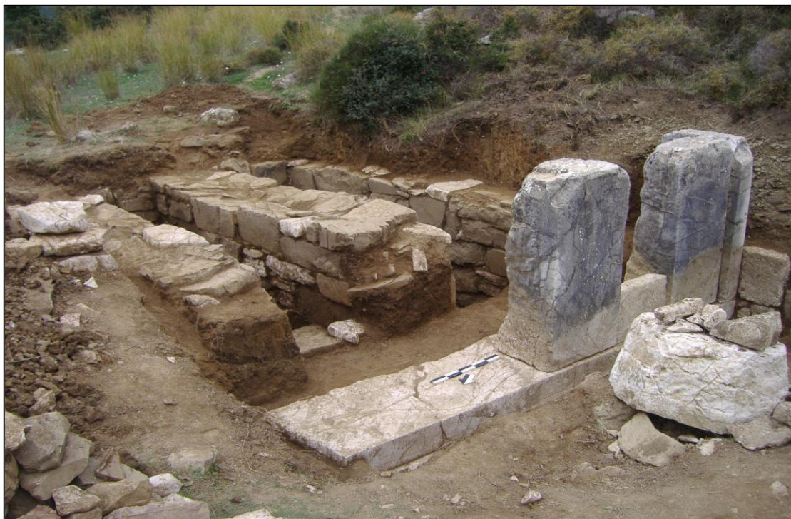
Εικόνα 397. Απόψη από Β του παραπάνω μνημείου μετά την ανασκαφή του 2006.