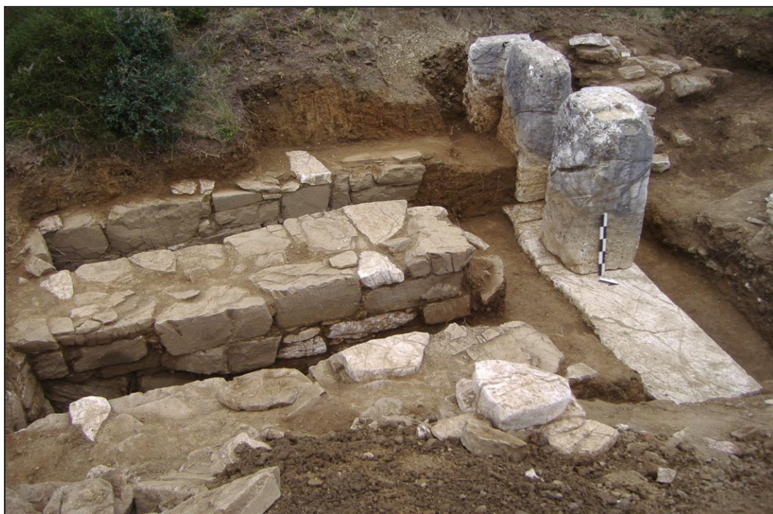
Εικόνα 399. Απόψη από ΒΑ του παραπάνω μνημείου μετά την ανασκαφή του 2006.