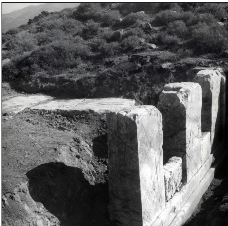
Εικόνα 396. Λήψη παλιάς ανασκαφής του ταφικού μνημείου Β στην Αλίφειρα από Α. Ορλάνδο (δεκαετία του 1930). Απόψη από Β.

Ένα από τα προαναφερόμενα ταφικά μνημεία της Αλίφειρας, το ναόσχημο ταφικό μνημείο Β των Αντιπάτρου και Τερ(π)αινέτου το οποίο είχε αναστηλωθεί και μερικώς ερευνηθεί μεταξύ του 1932-1935 (Ορλάνδος 1967-68, 219-225) βρίσκεται στη θέση «Διάσελο» ή «Το αλώνι των Τασαίων», π. 500 μ. Ν. του ναού της Αθηνάς, στα πρανή του λόφου «Νεροσίτσα», όπου η αρχαία ακρόπολη, και εντός του ευρύτερου κρηυγμένου αρχαιολογικού χώρου της Αλίφειρας. Στο μνημείο αυτό πραγματοποιήθηκε το 2006 σωστική ανασκαφική έρευνα κατόπιν λαθρανασκαφής. Στα 70 περίπου χρόνια που μεσολάβησαν είχε κρημνισθεί ο τρίτος (βόρειος) πεσσός που φέρει την επιγραφή Αντίπατρος και αποκρουστεί το κάτω μέρος του ενώ κατά την πιο πρόσφατη αυθαίρετη ενέργεια είχαν αφαιρεθεί και κατακερματιστεί οι τρεις μεγάλες καλυπτήριες πλάκες από ακατέργαστο λευκό σχιστογενή ασβεστόλιθο της νότιας θήκης, διαστάσεων 1,90x0,4 και βάθους 1,70 μ. (ΕΙΚ. 394-396 & 397-400). Τα τοιχώματα ήταν χτισμένα με αργολιθοδομή, από πέτρες ψαμμίτη και σε μερικά σημεία από ασβεστόλιθο. Παρουσιάζει τη σπάνια αλλά χαρακτηριστική μορφολογία των αρκαδικών κιβωτιόσχημων τάφων με ενδιάμεση λίθινη εσχάρα, ίχνη της οποίας βρέθηκαν σε βάθος 1,10 μ. (πβ. Kurtz & Boardman 1971, 197, εικ. 41).