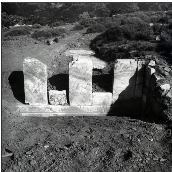
Εικόνα 395. Λήψη παλιάς ανασκαφής του ταφικού μνημείου Β στην Αλίφειρα από Α. Ορλάνδο (δεκαετία του 1930). Απόψη από ΒΔ.