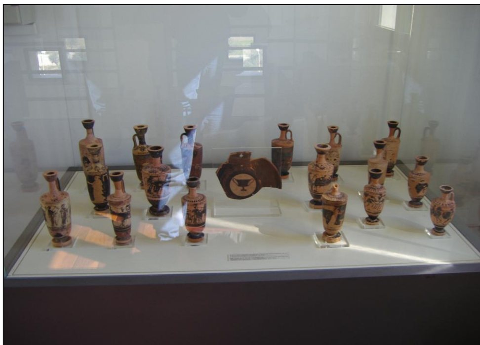
Εικόνα 391. Αγγεία κλασικών χρόνων από το χωριό Μαρινάκι (Αγ. Δημήτριος), αρχαίας Ήλιδας σύγχρονα με αυτά των Σαβαλίων (Μουσείο Ήλιδας).

Π4. Μελανόμορφη λήκυθος. Στο σώμα παράσταση ιππέων μεταξύ δύο οπλιτών, κάτω από στικτή ταινία. Στον ώμο σειρά καλύκων. Ύψος 0,16 μ. Πρώιμος 5ος αι. π.Χ.