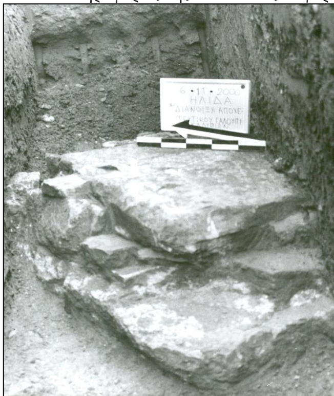
Εικόνα 401. Γαλούπι Ήλιδας, ΒΔ τμήμα του υστερορωμαϊκού κιβωτιόσχημου τάφου 1.

Ο δεύτερος κεραμοσκεπής τάφος ήταν ακτέριστος και βρέθηκε σε καλύτερη κατάσταση. Και εδώ ο νεκρός ήταν στραμμένος προς τα Δ, αλλά το γεγονός ότι το δεξί του άνω άκρο ήταν λυγισμένο πάνω στο στήθος (κάτι που δεν μπορούσε να διαπιστωθεί στον προηγούμενο τάφο) και η έλλειψη κτερισμάτων, ίσως σημαίνει την υιοθέτηση απλούστερων χριστιανικών πρακτικών προς το τέλος της αρχαιότητας και στην Ήλιδα. Προς την κατεύθυνση αυτή, δηλ, την αποκρυπτογράφηση μέσω της ανασκαφικής έρευνας και ανασύσταση των ταφικών εθίμων, σημαντικές είναι οι πληροφορίες της τελευταίας συγκριτικής αναφοράς μας.