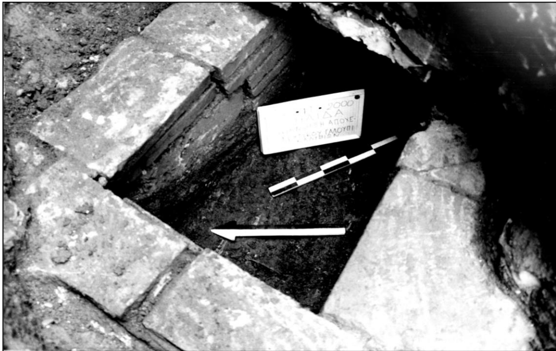
Εικόνα 402. Γαλούπι Ήλιδας, εσωτερικό του υστερορωμαϊκού κιβωτιόσχημου τάφου 1.

Επιπλέον, η ανομοιομορφία των τάφων και μάλιστα ανά συστάδα, υποδηλώνει, ενδεχομένως την ύπαρξη κοινωνικής διαστρωμάτωσης. Στις νεότερες συστάδες, φαίνεται ότι η διαφορά αυτή τονίζεται και από τον μεγαλύτερο αριθμό των κτερισμάτων στους κιβωτιόσχημους τάφους.