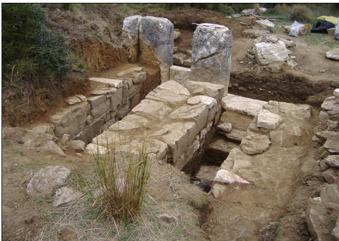
Εικόνα 398. Απόψη από Α του παραπάνω μνημείου μετά την ανασκαφή του 2006.