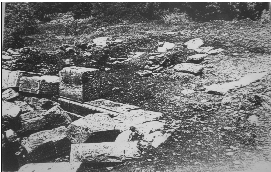
Εικόνα 393. Το ταφικό μνημείο Α της Πλατιάνας από ΒΑ.

ηρωοποίησης της νεκρής (ό.π., 57-58, IXb) χαραγμένο σε τρεις στίχους: ΤΥΜΒΟΣ Ο ΜΥΡΙΟΚΛΑΥΣΤΟΣ ΟΔ/ΟΙΠΟΡΕ ΑΚΤΗΣ ΕΣΤΙ ΗΣ Ο ΤΡΟΠ/[ΟΣ ΒΙΟ]Υ (ή ναού) ΑΕΙΟΣ ΟΥΧΙ ΤΑΦΟΥ. Οι επιφάνειες της στήλης πλην της οπίσθιας είναι επιμελώς επεξεργασμένες. Χρονολογείται στην ύστερη ελληνιστική εποχή. Λ4102: Επιτύμβια στήλη με ιωνικού τύπου επίστεψη σωζόμενου ύψους 0,46 μ.: ανακλιντροειδές κάτω από οδοντωτό γείσο και αέτωμα. Χαμηλότερα δύο ρόδακες σε χαμηλό ανάγλυφο. Ελληνιστικής εποχής. Από την αγορά της Ήλιδας.