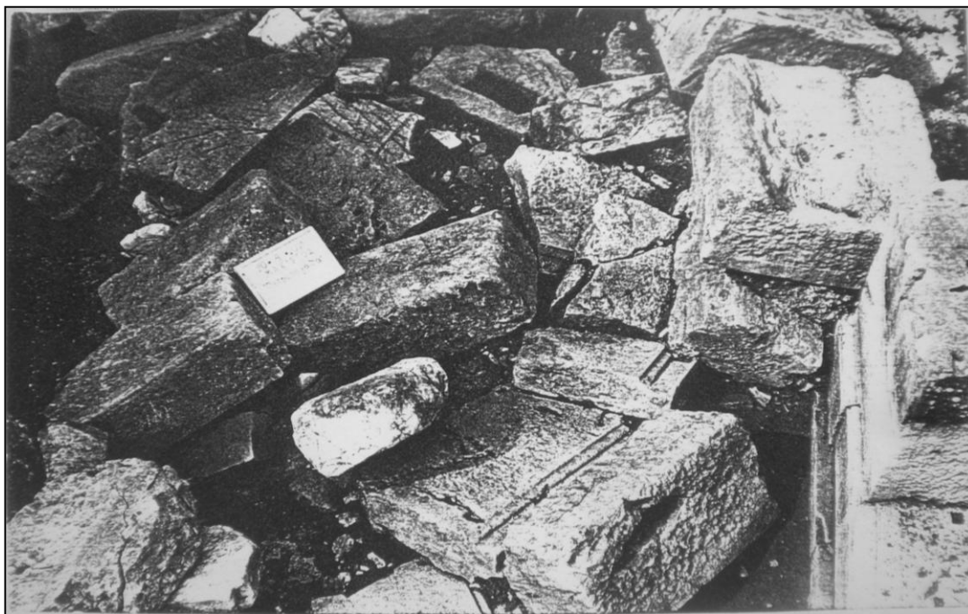
Εικόνα 392. Πλατιάνα ταφικό μνημείο Α: κρημνισθείσα πρόσοψη.