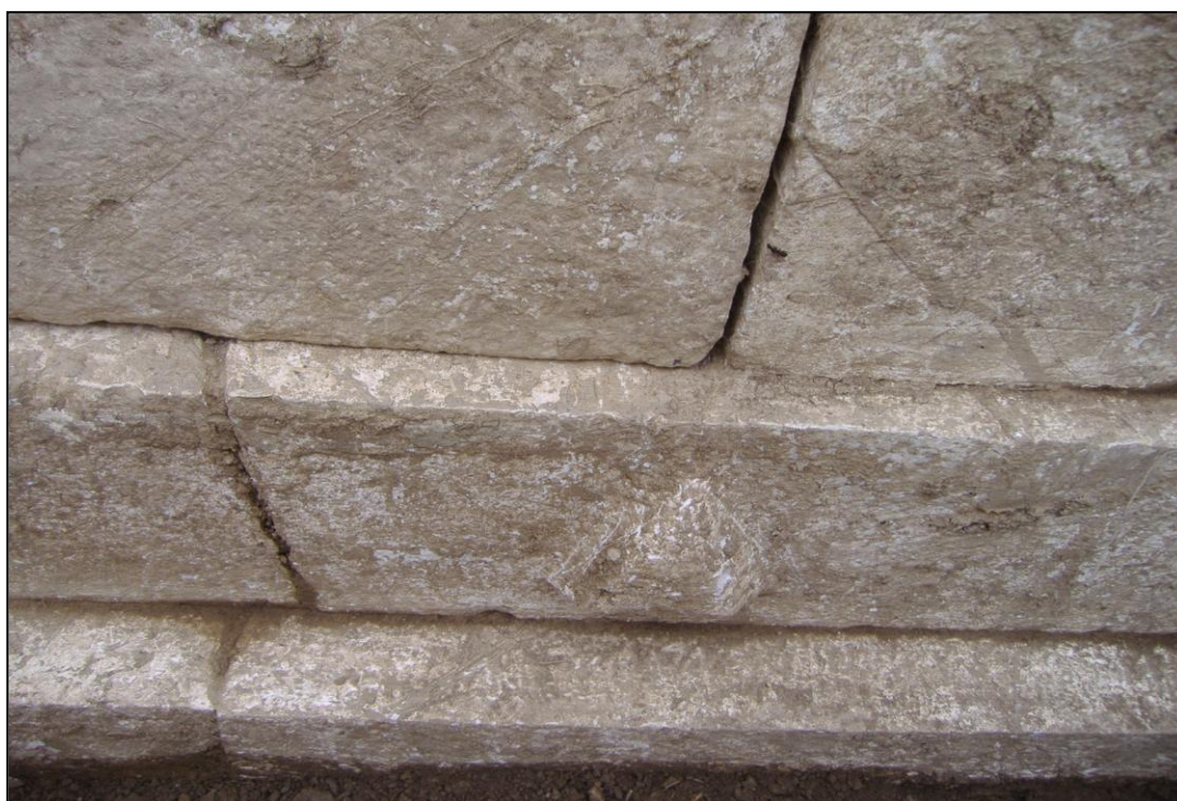
Εικόνα 400. Λεπτομέρεια της κρηπίδας του παραπάνω μνημείου μετά την ανασκαφή του 2006.

Το ταφικό μνημείο διέθετε και δεύτερη (B2) 17 δίδυμη θήκη η οποία αντιστοιχούσε στο άνοιγμα ανάμεσα στο μεσαίο και τον τρίτο πεσσό. Η θήκη αυτή είχε συληθεί παλαιότερα και δεν διατηρούσε τις καλυπτήριες πλάκες. Σε βάθος 1,10 μ. αποκαλύφθηκαν και εδώ τα ίχνη της εσχάρας οι