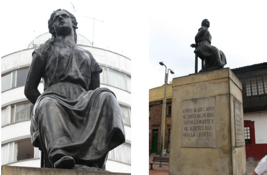
Estatua de Policarpa Salavarrieta en la Plazoleta de las Aguas, Bogotá