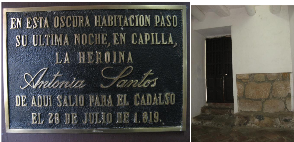
Inscripción y detalle de la habitación en la Casa de la Cultura, Socorro