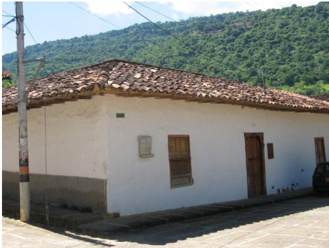
Exterior de la casa de Antonia Santos en Pinchote