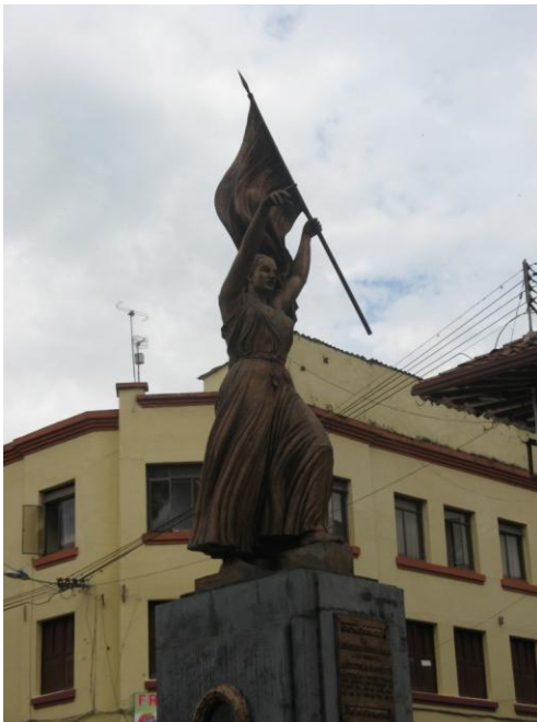
Estatua de Antonia Santos en la Plaza del Socorro