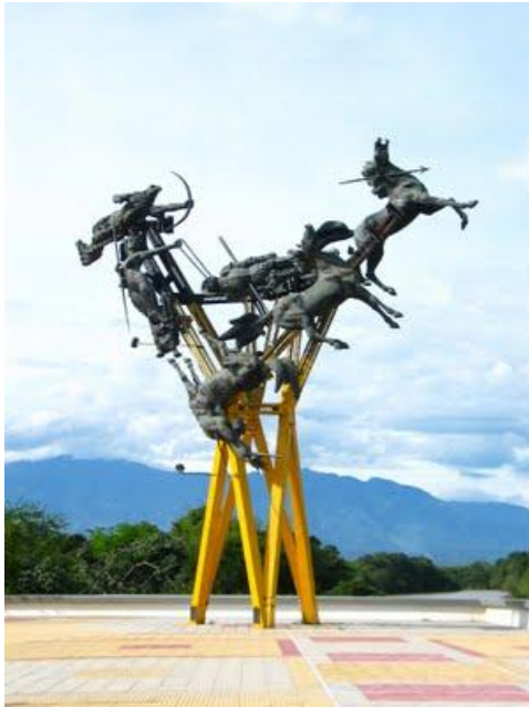
Monumento de Arenas Betancourt en Neiva