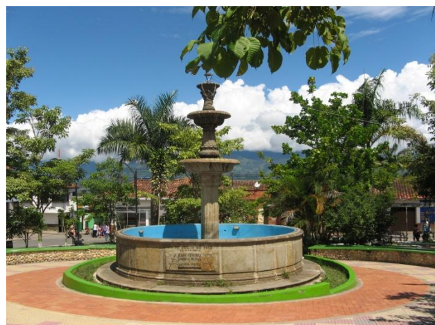
Pila de agua dedicada a Manuela Beltrán y Antonia Santos en la Plaza de Chiquinquirá en el Socorro