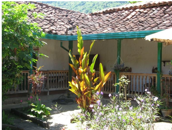
Patio interior de la casa de Antonia Santos en Pinchote

Esta casa fue en un tiempo un pequeño hostel y en la actualidad se encuentra en remodelación con miras a reabrir un nuevo hotel.