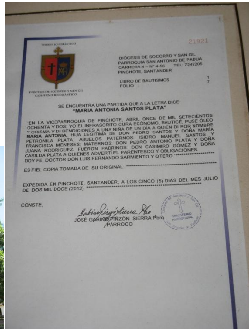
Estatua de Antonia Santos en Pinchote Copia de la partida de bautismo de Antonia Santos en la parroquia de Pinchote