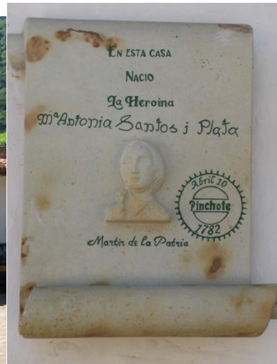
Detalle del lado de la ventana