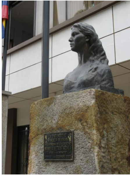
Busto de Manuela Beltrán en la Plaza Principal del Socorro