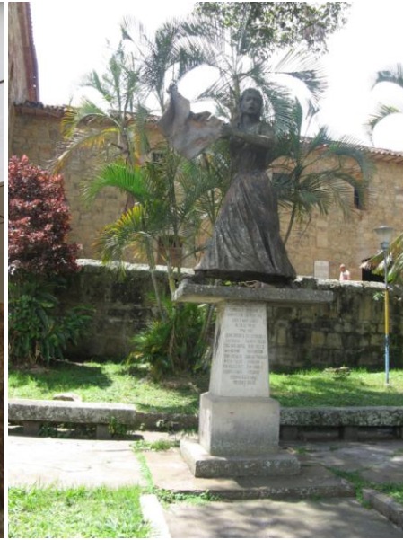
Estatua de Manuela Beltrán cerca del Convento de los capuchinos en Socorro

Las posibles palabras de Manuela pudieron ser: