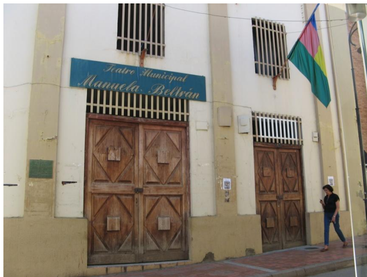
Teatro Manuela Beltrán en el Socorro