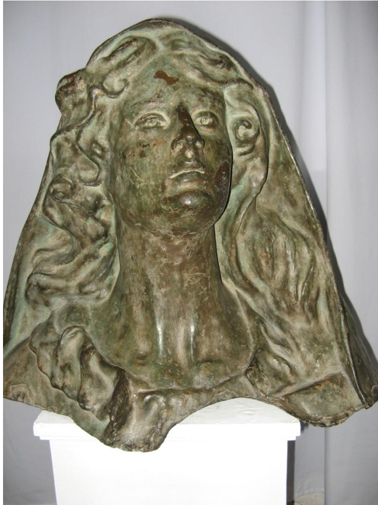
Busto de Antonia Santos perteneciente a una estatua desmontada en la Plaza de Socorro. En la actualidad sólo existe este busto que se encuentra en la Casa de la Cultura, Socorro.

mis últimas horas sobre la tierra. Cómo brillan las estrellas en la noche magnífica. ¿Estará allá el cielo donde quiero ir...?” 10