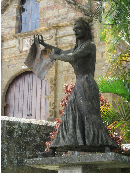
Estatua de Manuela Beltrán, cerca del Monasterio de los Capuchinos en Socorro