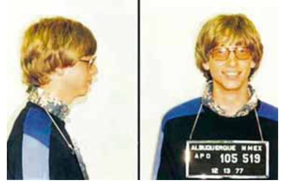
Handtekinn Bill Gates , sem um árabil var ríkasti maður heims, braut umferðalög í Nýju Mexíkó þegar hann var 22ja ára.

Hinn skoskættaði leynilögrelumaður og njósnari,