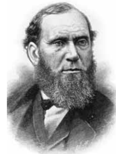
Frumkvöðull Allan Pinkerton , stofnaði fyrsta leynilögrelufyrirtækið í Bandaríkjunum.

sjötta áratug átjándu aldrar stofnaði hann í félagi við lögfræðing í borginni annað slíkt fyrirtæki, sem enn er við lýði undir öðru nafni innan vébanda Securitas. Einkunnarorð fyrirtækisins var „Við sofum aldrei“ og merki þess upplengt auga.